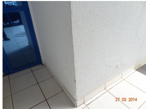
Foto 2 - Revestimento e pintura recuperada.