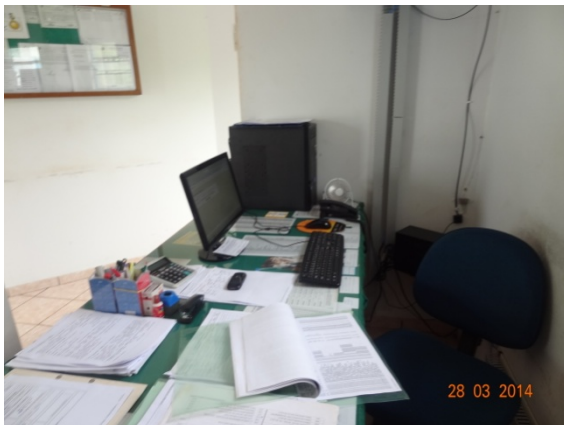
Foto 1- Escritório Informatizado.