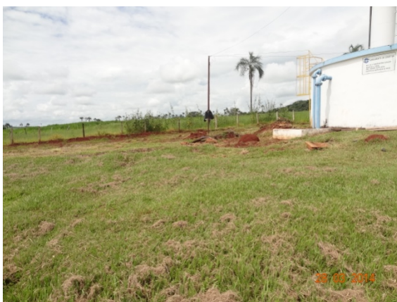
Foto 3- Limpeza, conservação e segurança adequadas