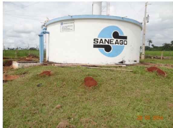
Foto 2- Pintura recuperada.