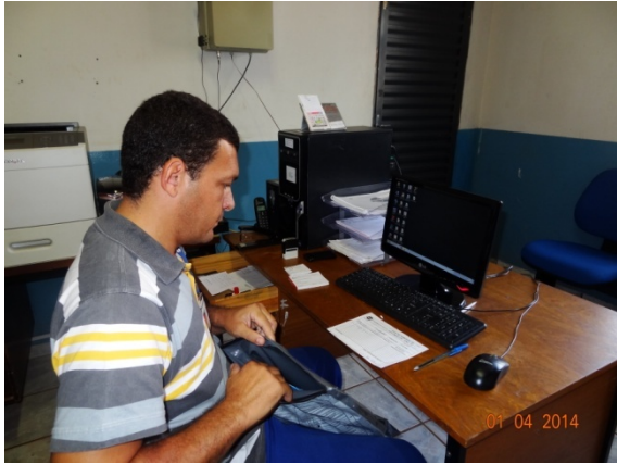
Foto 1 - Escritório informatizado