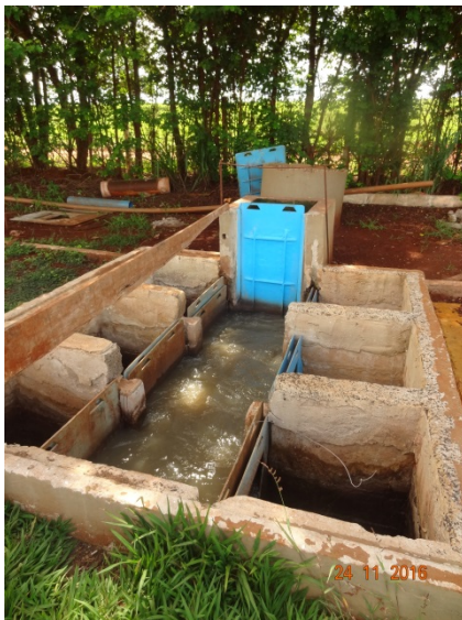
Foto 7 – Melhorias implantadas na chegada de esgoto na ETE para evitar extravasamento