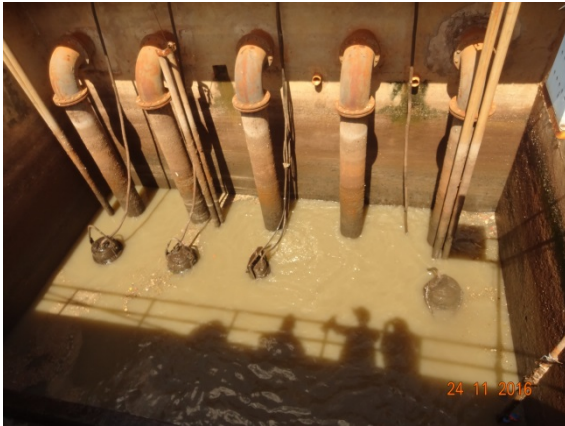
Foto 5 - Conjuntos moto bombas com funcionamento simultâneo na EEE IV