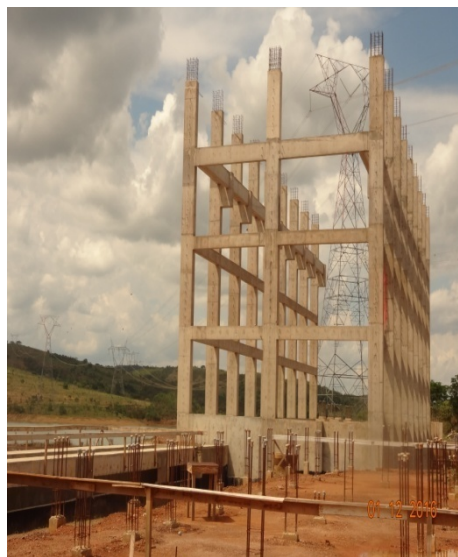
Foto 4 -Estruturas já construídas na EEAB Corumbá-1º e 02/12