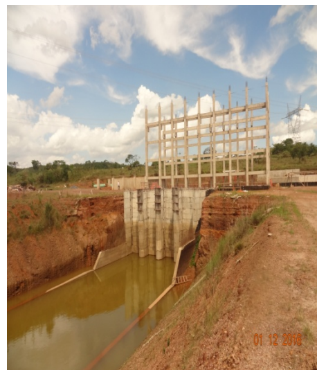
Foto 8 -Entrada água e estrutura na EEAB Corumbá-1º e 02/12