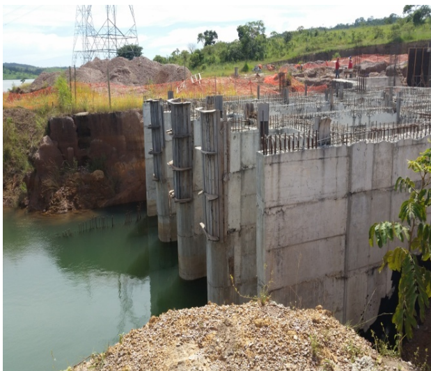
Foto 7 - Entrada água para bombas na EEAB Corumbá-31/03 e 1º/04