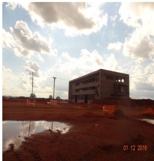
Foto 14 - ETA -Prédio Administração - 1º e 2/12