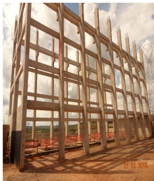
Foto 4 -Estruturas já construídas na EEAB Corumbá-1º e 02/12