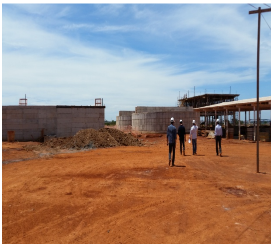
Foto 19 - Obras área Tanques de Tratamento - 31/03 e 1º/04