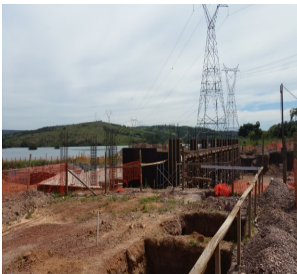
Foto 3 - Escavações na EEAB Corumbá-31/03 e 1º/04