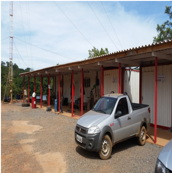
Foto 1 -Salas da Administração obras na EEAB Corumbá-31/03 e 1º/04