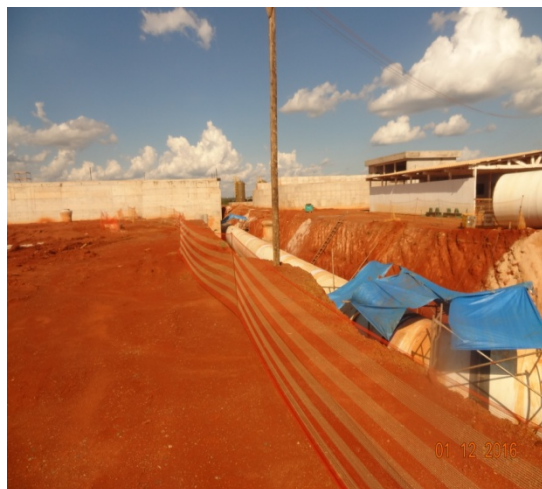
Foto 20 - Interligações área de Tanques - 1º e 2/12