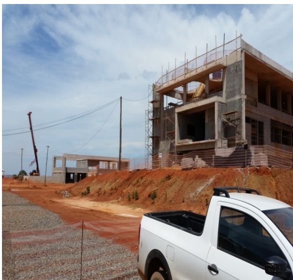
Foto 13 - ETA - Prédio Administração e início área Casa de Química -31/03 e 1º/04