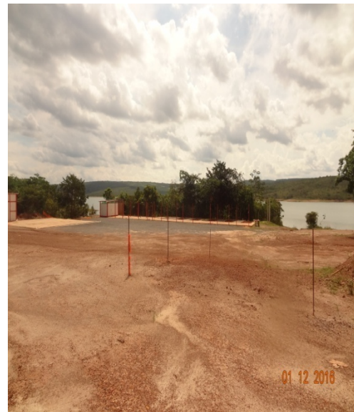
Foto 2 - Removidas salas da Administração obras na EEAB Corumbá-1º e 02/12