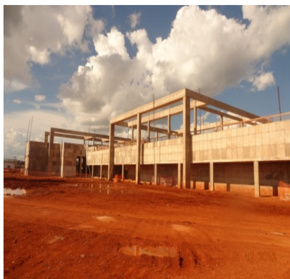
Foto 18 - ETA - Obras área Tanques de Tratamento - 1º e 2/12