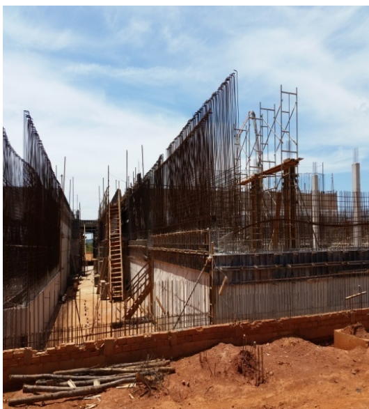
Foto 17 - ETA - Obras área Tanques de Tratamento - 31/03 e 1º/04