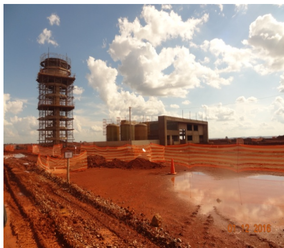
Foto 16 - ETA - Obras área Casa de Química - 1º e 2/12