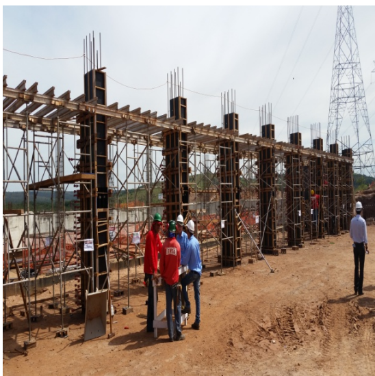
Foto 3 -Início amarração estruturas na EEAB Corumbá-31/03 e 1º/04