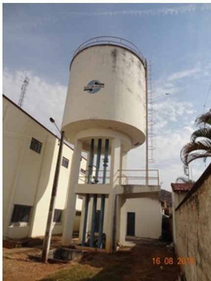
Foto 5 - Pintura desgastada.