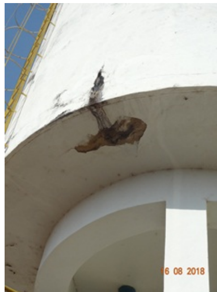
Foto 6 - Perda de revestimento REL/Centro.