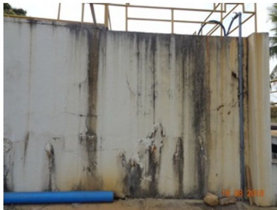
Foto 2 - Pintura desgastada.