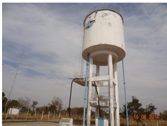
Foto 4 - Pintura desgastada REL St. Planalto