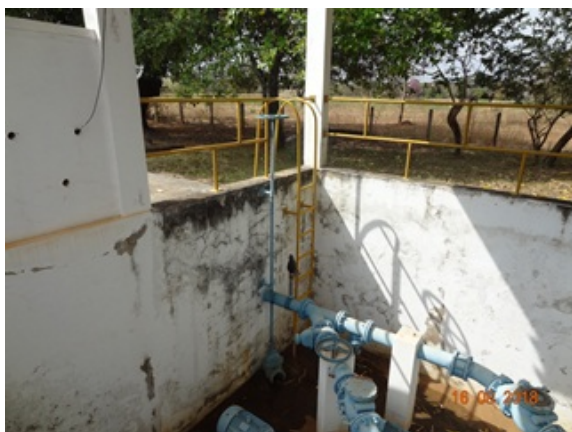
Foto 7 Falta guarda-corpo escada na EEAT/ETA.