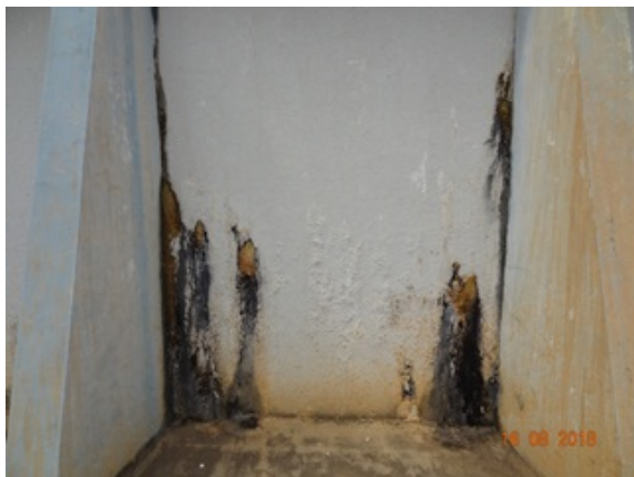
Foto 1 - Presença de infiltrações e eflorescências.