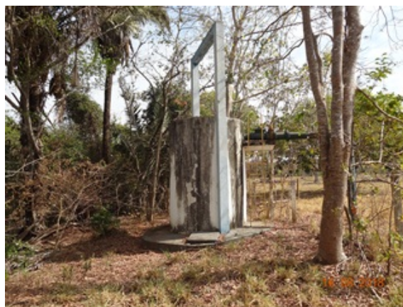
Foto 8 -Pintura desgastada Poço Sucção Captação/EEAB.