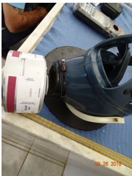
Foto 3 - Mascara para manuseio do cloro com filtro vencido.