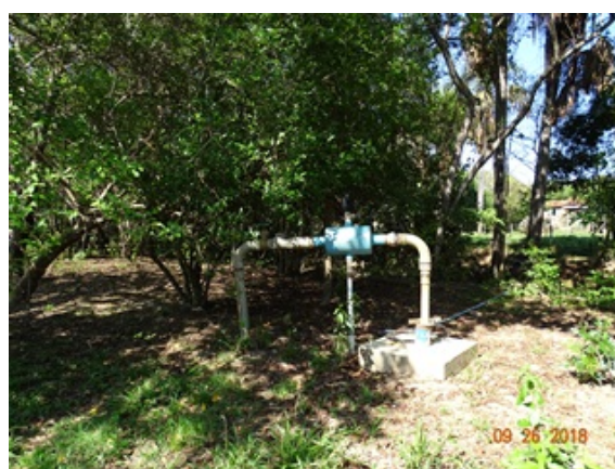
Foto 6 - Poço sem identificação e sem cerca de proteção.