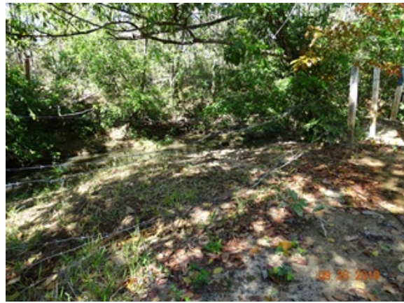
Foto 8 - Cerca danificada.