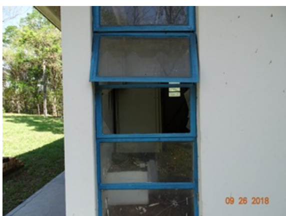
Foto 5 - Vidros quebrados.