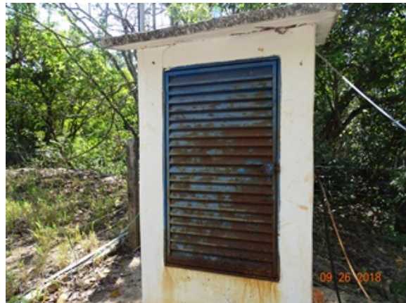
Foto 10 - Pintura desgastada.