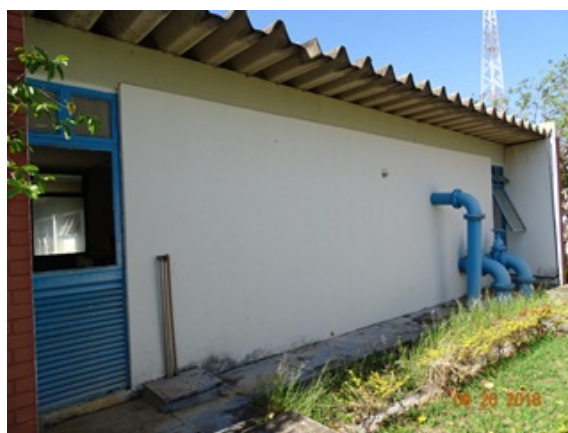
Foto 4 - Vidros quebrados.