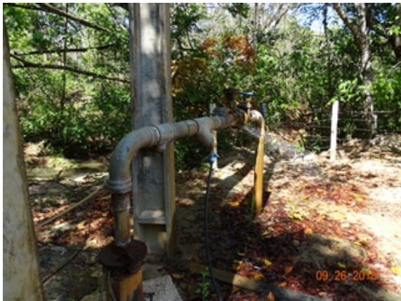
Foto 9 - Vazamento carritel do cavalete.