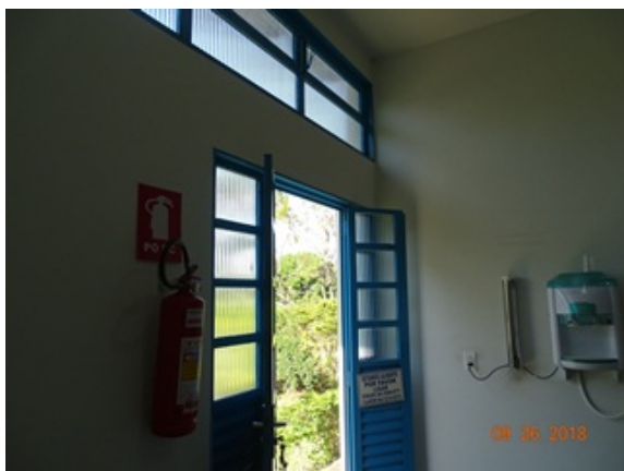
Foto 1 - Falta identificação de bebedouro.