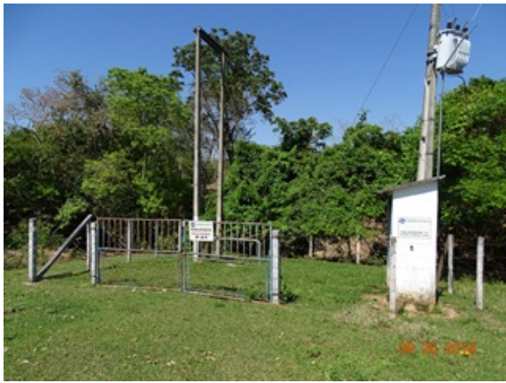
Foto 7 - Pintura desgastada.