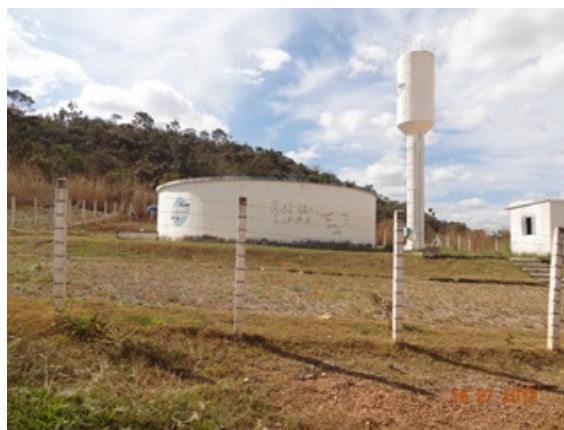
Foto 10 - C.R. Setor Lunabel com reservatórios instalados.