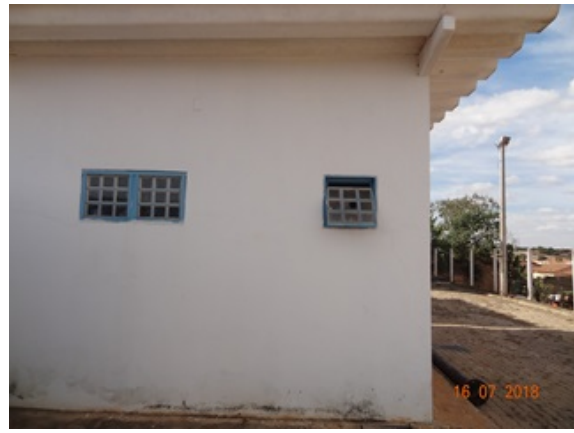
Foto 4 - C.R. Santa Luzia urbanizado.