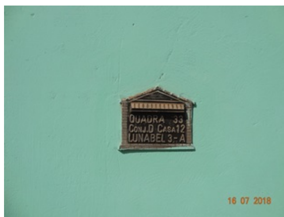
Foto 12 - Casas populares Lunabel.