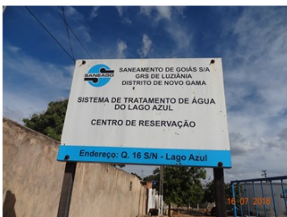
Foto 13 - C.R. Lago Azul.