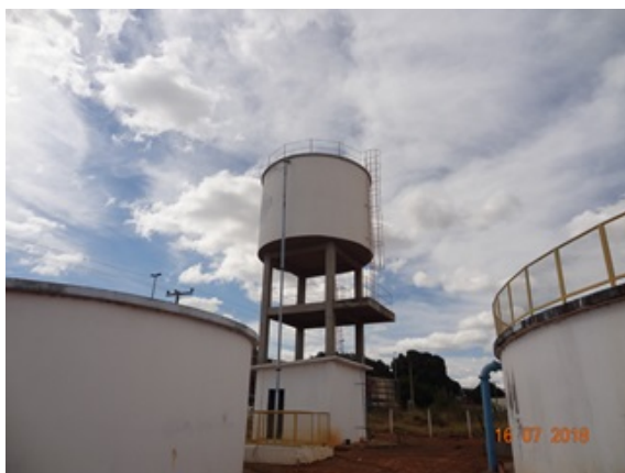
Foto 9 - C.R. Boa Vista com reservatórios instalados.