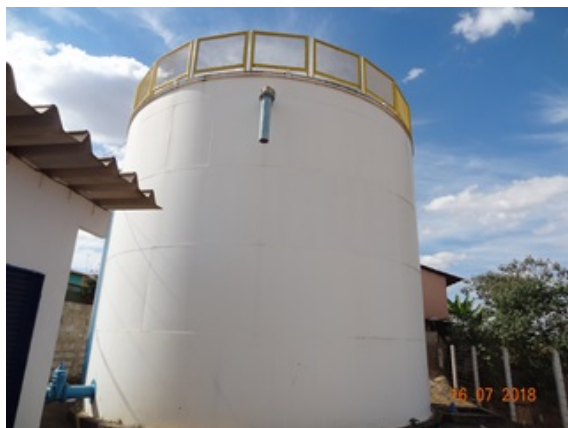
Foto 1 - C.R. Santa Luzia R.A.P metálico 200 m 3 .