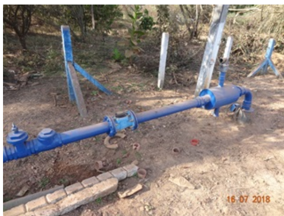
Foto 18 - Poço P 28 interligado à caixa de reunião.