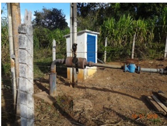
Foto 17 - Poço P 22 interligado à caixa de reunião.