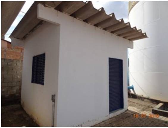
Foto 3 - C.R. Santa Luzia casa de química.