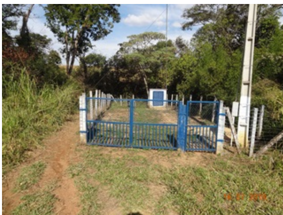
Foto 15 - Poço P 05 interligado à caixa de reunião.