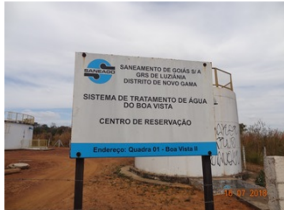
Foto 8 - C.R. Boa Vista identificado.