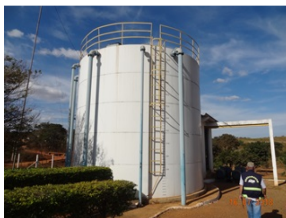
Foto 14 - Caixa de Reunião com poços interligados.