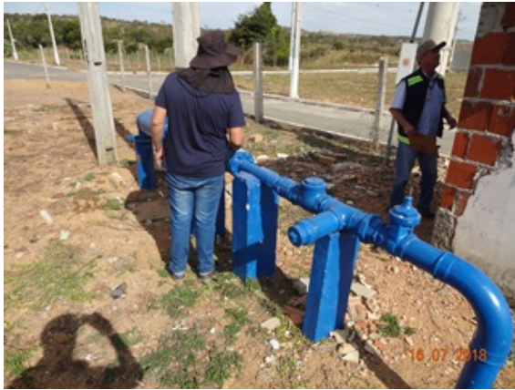
Foto 5 - Poço 14 urbanizado bairro Santa Luzia.