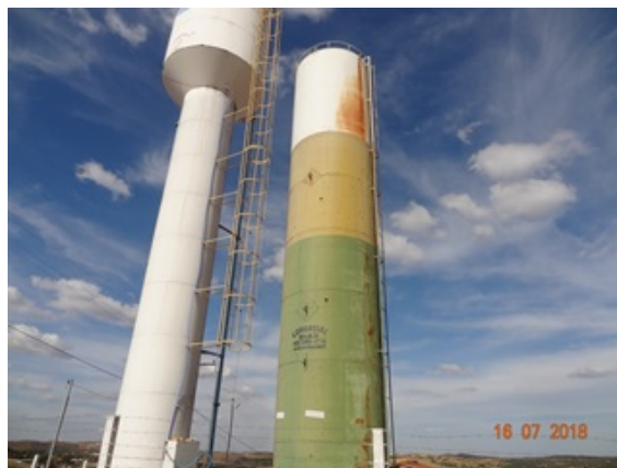
Foto 2 - R.E.L setor Santa Luzia metálico 50 m 3 .