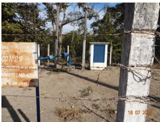
Foto 19 - Poço P 29 interligado à caixa de reunião.