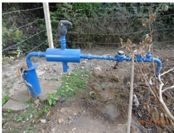
Foto 16 - Poço P 12 interligado à caixa de reunião.