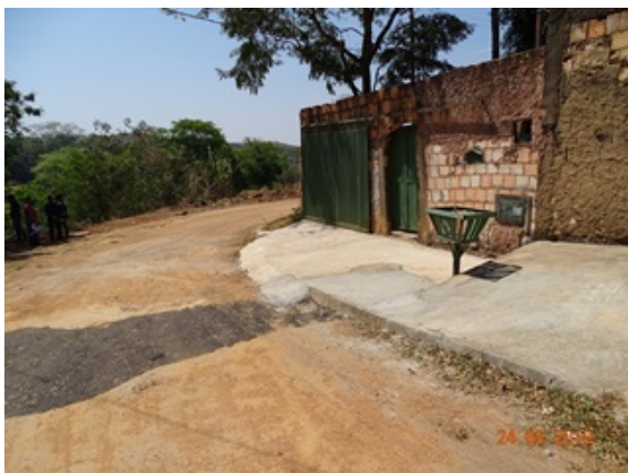
Foto 7 - Local de extravasamento de esgoto no Jardim Lago Azul, Novo Gama - GO.