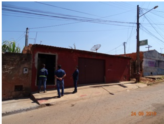
Foto 2 - Entrevista com moradores do Setor Minas Gerais, Novo Gama, GO.