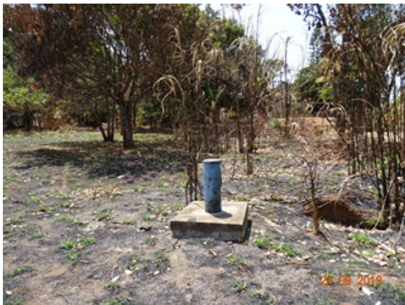
Foto 5 - Poço PGD 55