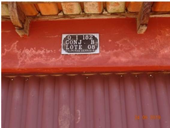
Foto 1 - Endereço de morador entrevistado no Setor Minas Gerais, Novo Gama, GO.