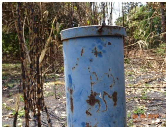
Foto 4 - Poço PGD 55