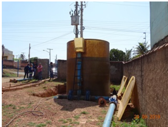
Foto 6 - Filtro Russo