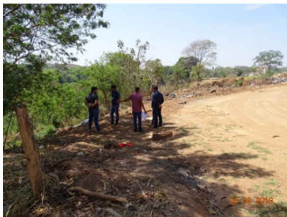
Foto 8 - Local de extravasamento de esgoto no Jardim Lago Azul, Novo Gama - GO.