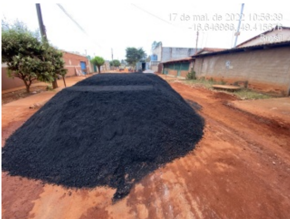
Foto 9 - CBUQ utilizado na recomposição de vias pavimentadas.