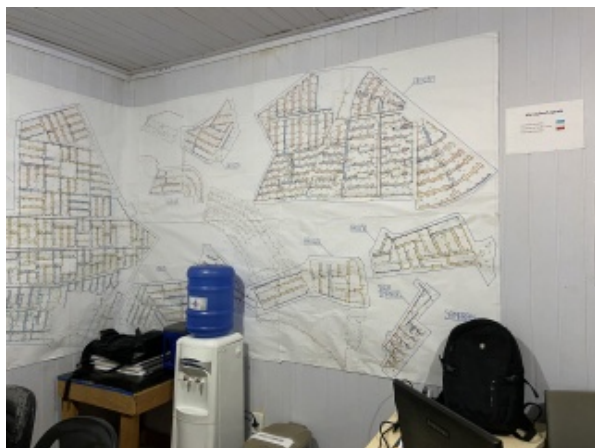
Foto 1 - Mapa iluminado dos bairros, com serviços em andamento e concluídos.