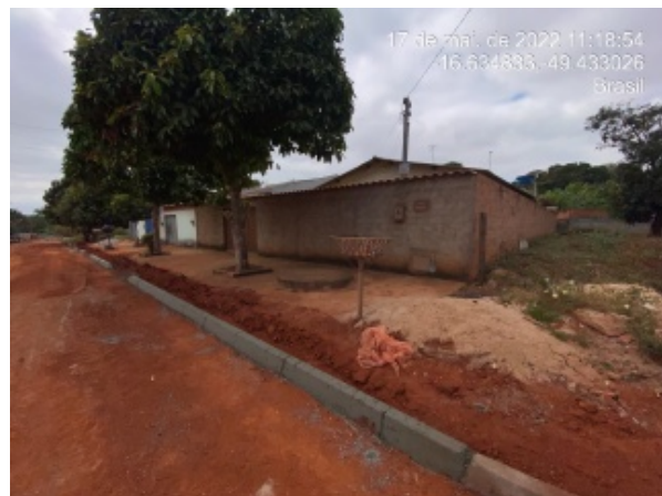
Foto 10 - Recomposição de guia da calçada sendo executada.