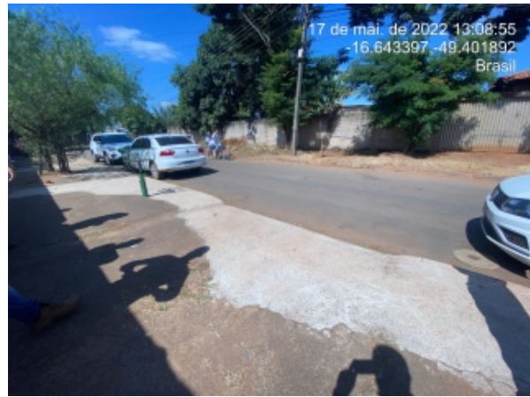
Foto 14 - Recomposição de calçada e pavimento asfáltico finalizado.