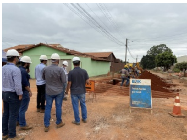
Foto 3 - Fiscalização das obras.