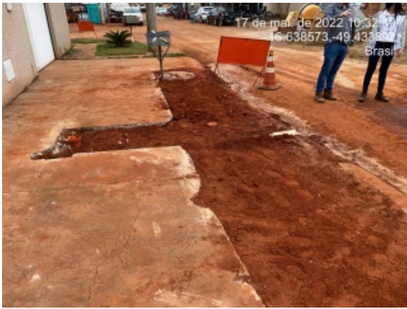
Foto 5 - Trabalho da equipe de escavação finalizado na calçada.