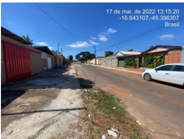
Foto 15 - Danos no pavimento possivelmente por ausência e/ou deficiência de drenagem pluvial.