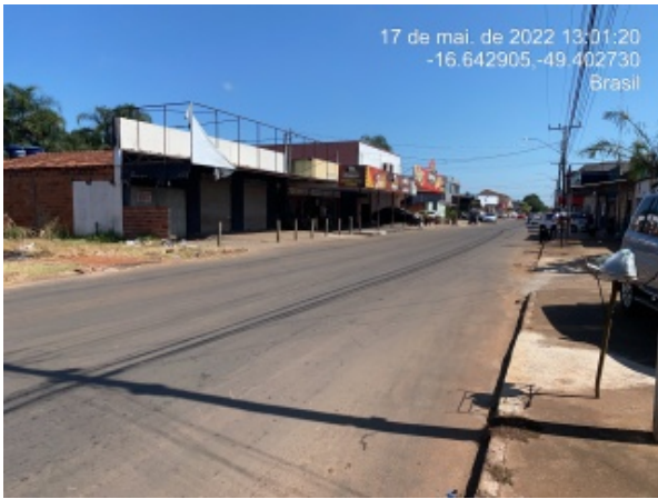
Foto 13 - Recomposição de calçada e pavimento asfáltico finalizado.