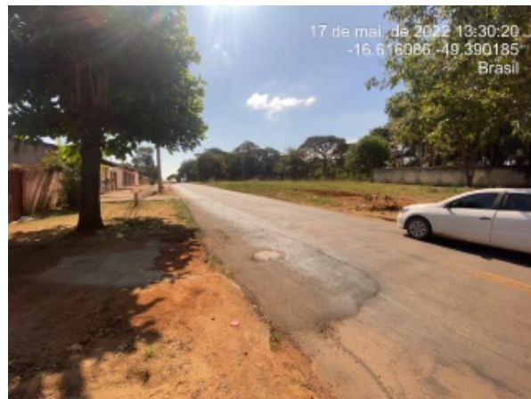
Foto 18 - Reparo realizado na rede coletora de esgoto devido à problema de recalque.