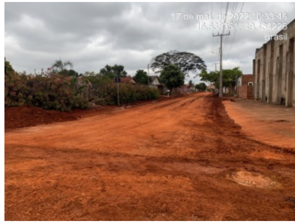
Foto 6 - Trabalho da equipe de escavação finalizado na rua.