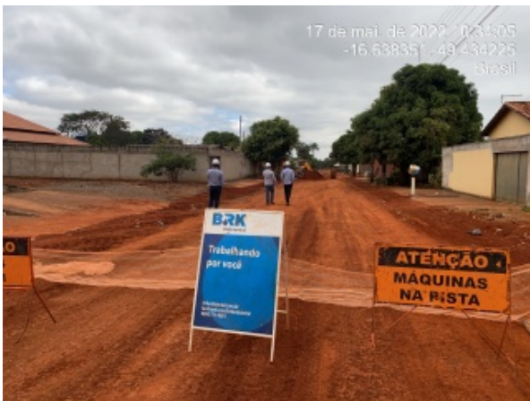
Foto 7 - Interdição de ruas e sinalização.