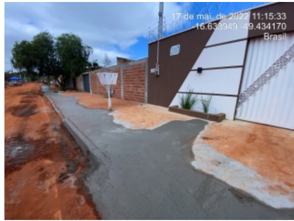
Foto 12 - Recomposição de calçada finalizada.