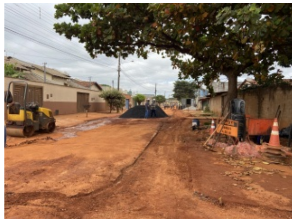
Foto 8 - Equipe de recomposição trabalhando.