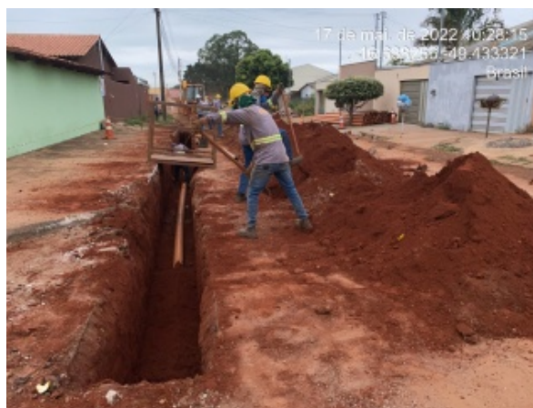
Foto 4 - Equipe de escavação em serviço.