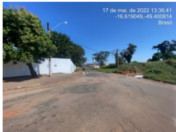
Foto 20 - Rua Figueirópolis, Conjunto Dona Iris, obras para redução da velocidade de escoamento superficial da água pluvial.