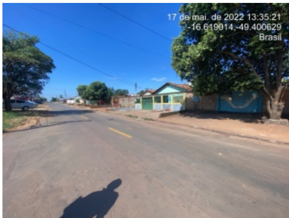
Foto 19 - Rua Figueirópolis, Conjunto Dona Iris, com problemas recorrentes no pavimento asfáltico devido a declividade local e a elevada velocidade de escoamento superficial da água pluvial.