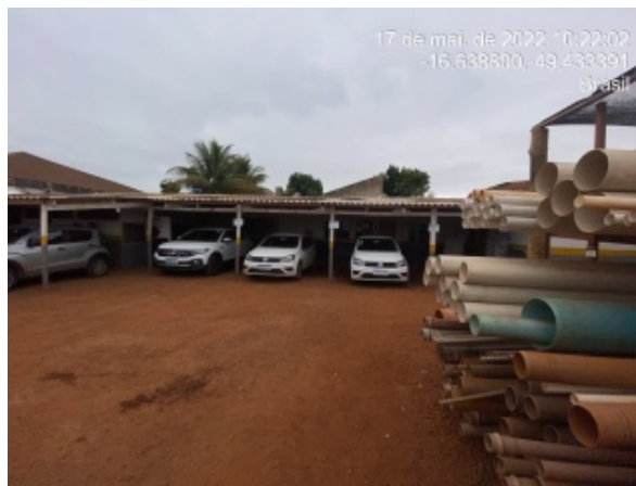
Foto 2 - Canteiro de obras da CCB Construtora.