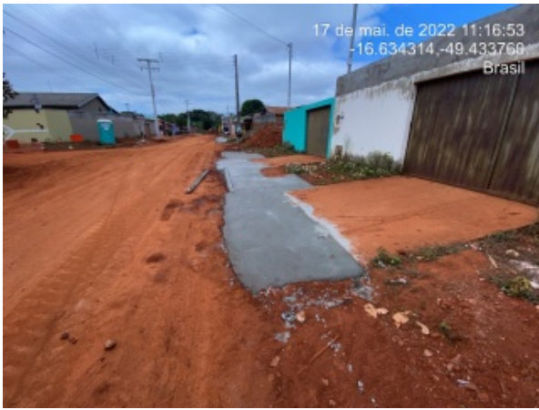
Foto 11 - Recomposição de calçada sendo executada.