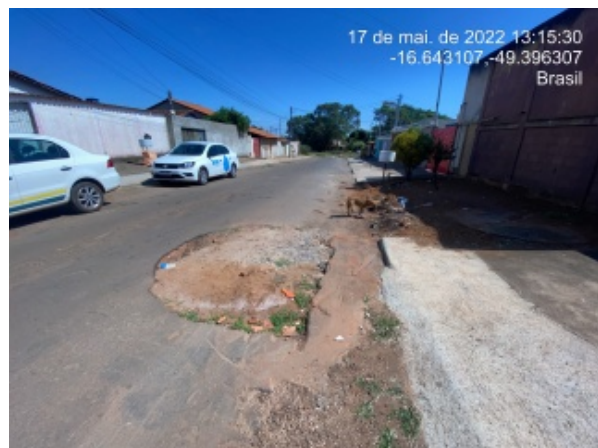
Foto 16 - Danos no pavimento possivelmente por ausência e/ou deficiência de drenagem pluvial.