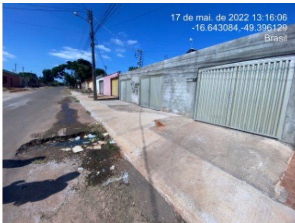
Foto 17 - Danos no pavimento possivelmente por ausência e/ou deficiência de drenagem pluvial.