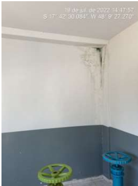
Foto 7 - ETA com presença de infiltração.