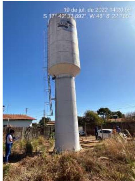
Foto 12 - Área do Reservatório R6 com mato alto.