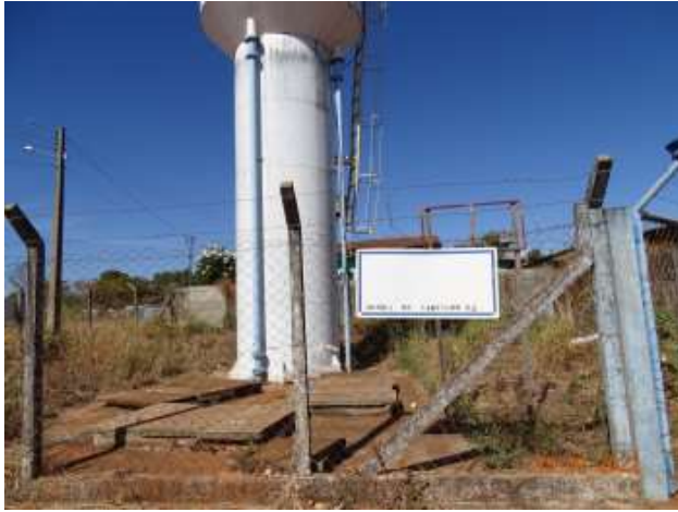
Foto 11 - Reservatório R6 com placa de identificação inadequada