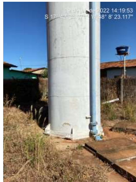
Foto 10 - Reservatório R6 com ausência de corrosão e com tampa adequada nas caixas de passagem.