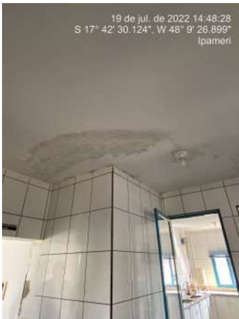
Foto 5 - ETA com presença de infiltração.