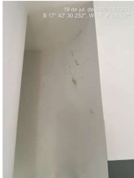
Foto 4 - Parede na ETA com resquícios de infiltração.