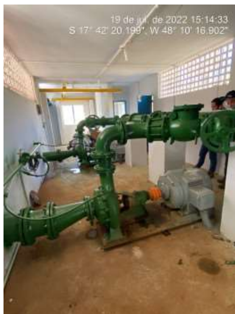
Foto 1 - EEAB com ausência de vazamento.