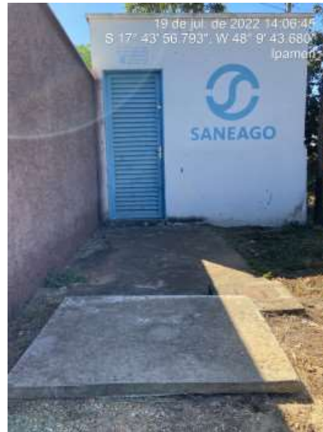
Foto 8 - Booster Jardim Europa com caixa de passagem com tampa adequada e presença de identificação.