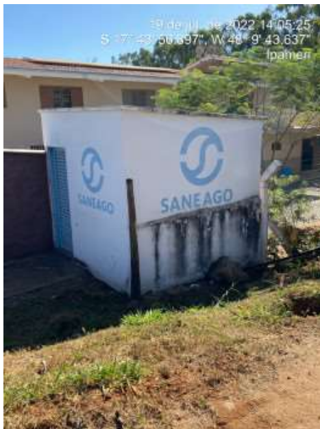
Foto 9 - Booster Jardim Europa com cerca recuperada.