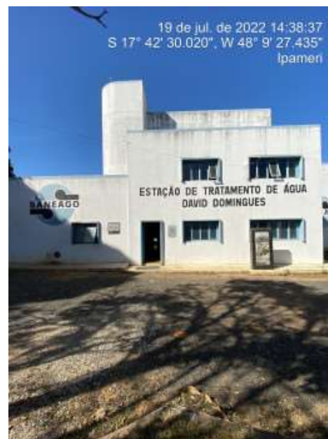
Foto 2 - Visão geral da ETA Davis Domingues em Ipameri.