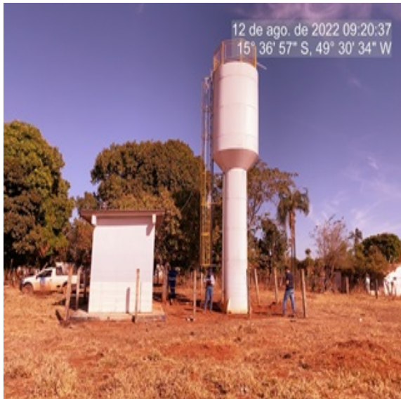
Foto 3 - Vista da área da ETA com REL novo instalado.