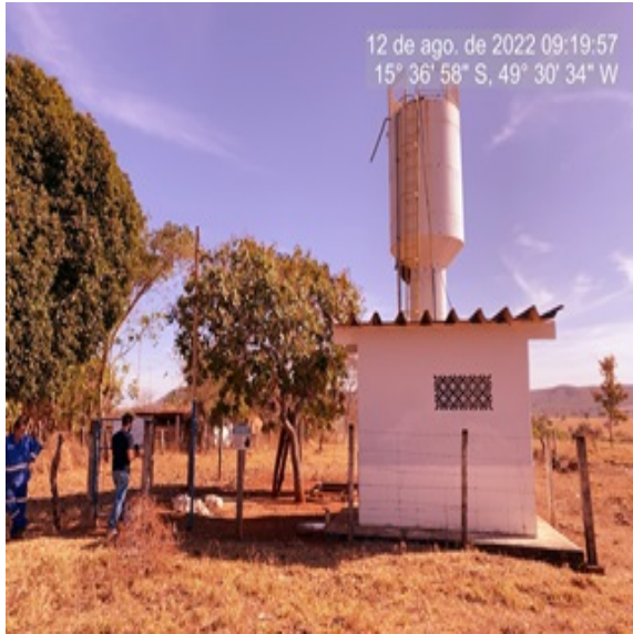
Foto 1 - Vista panorâmica da área da ETA de Santa Bárbara (Jaraguá).