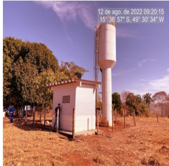
Foto 2 - Abrigo de tratamento da ETA com revestimento recuperado (interno e externo).