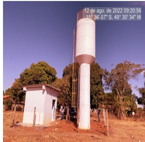
Foto 4 - Vista da área ETA com cerca de segurança renovada.