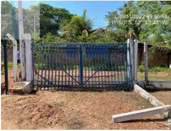
Foto 1 - Escritório comercial com cerca e portão recuperados.