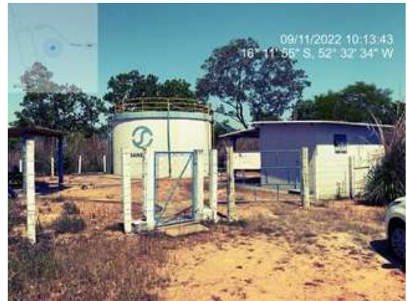
Foto 4 - ETA casa de química com edificação recuperada parte externa, e área urbanizada da ETA com limpeza adequada.