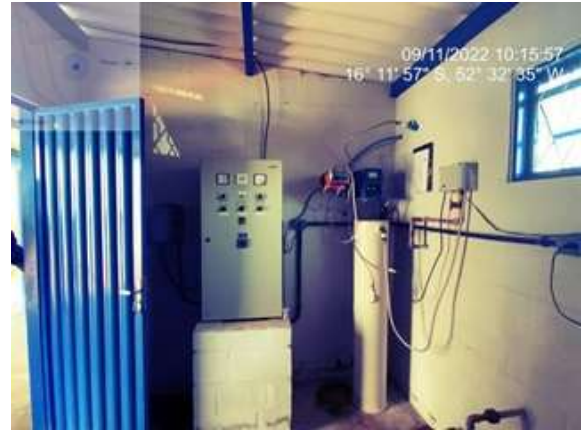
Foto 2 - ETA casa de química com edificações recuperadas parte interna.