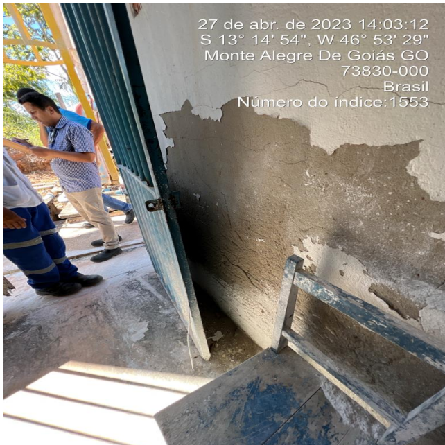
Foto 1 - ETA/Casa de química com perda de revestimento e pintura danificada.