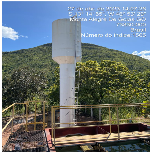
Foto 5 - ETA/REL de 10 m 3 sem guarda-corpos na escada de acesso ao topo.