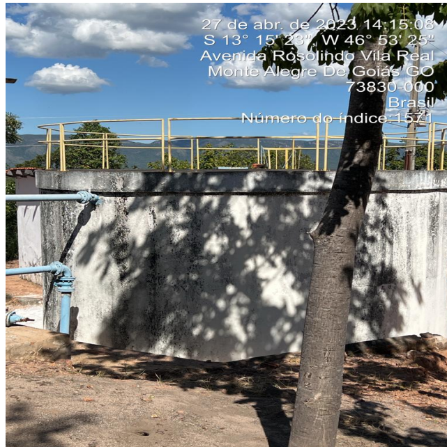
Foto 2 - ETA/RAP de 100 m 3 com pintura desgastada.