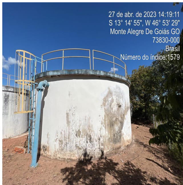
Foto 4 - ETA/RAP de 200 m 3 com pintura desgastada, e escada interna de manutenção corroída.