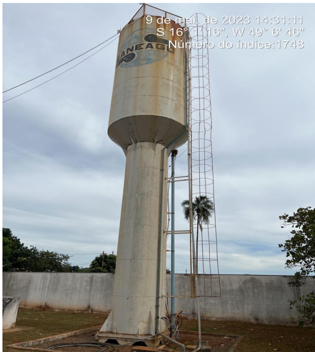
Foto 1 - REL/cidade com corrosão e pintura danificada.