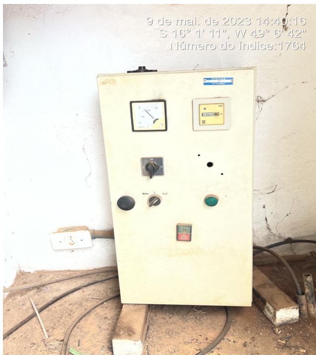
Foto 3 - Poço P1 sem aviso de risco no quadro de comando.