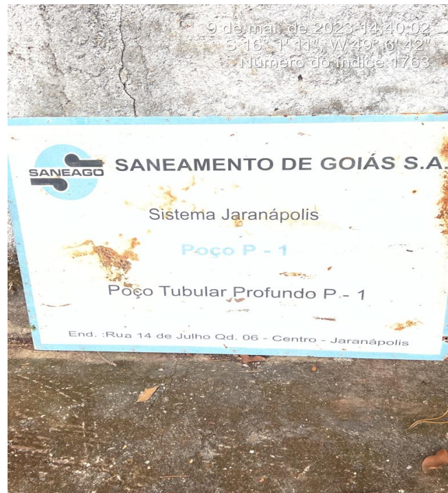
Foto 2 - Poço P1