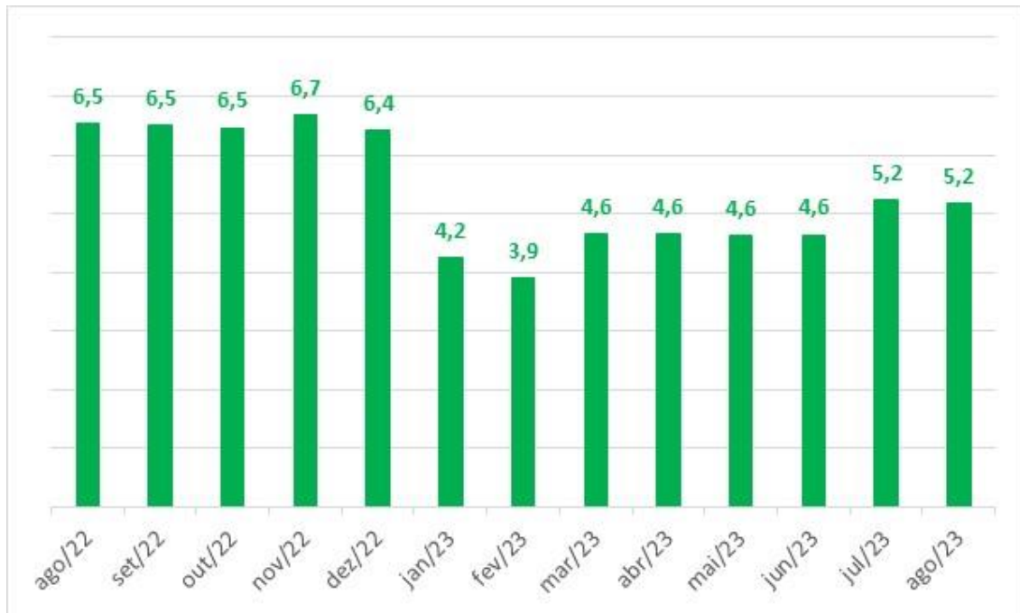
Gráfico 3: Variação acumulada no ano em relação ao mesmo período do ano anterior, em % - Goiás

Elaboração: Instituto Mauro Borges (IMB/ SGG) – 2023.