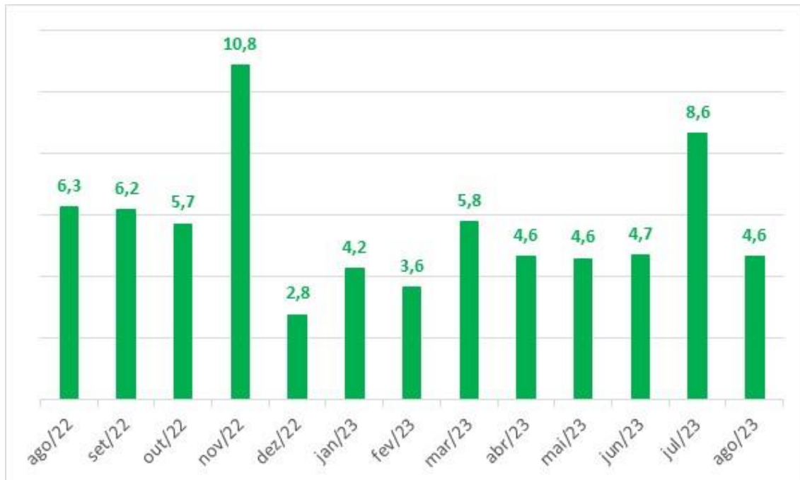
Gráfico 2: Variação mensal estimada do PIB em relação ao mesmo mês do ano anterior, sem ajuste sazonal, em % - Goiás

Elaboração: Instituto Mauro Borges (IMB/ SGG) – 2023.