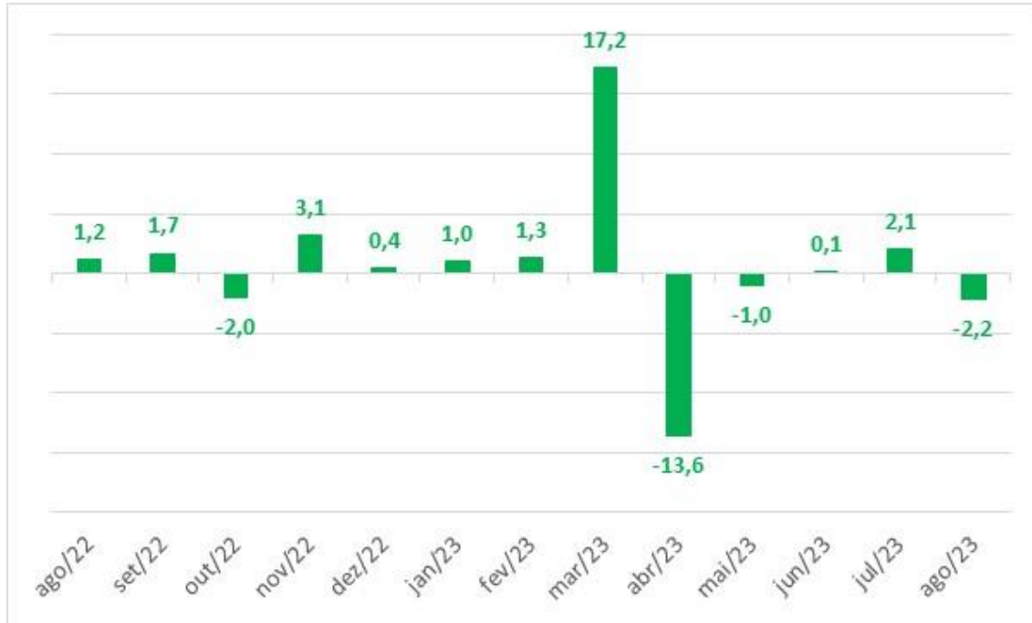
Gráfico 1: Variação mensal estimada do PIB em relação ao mês imediatamente anterior, com ajuste sazonal, em % - Goiás

Elaboração: Instituto Mauro Borges (IMB/ SGG) – 2023.