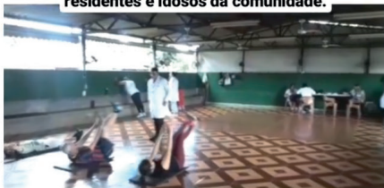
Os idosos da Casa do Idoso Vila Mutirão voltam a ter dignidade com fisioterapeutas e enfermeiros, dando uma melhor qualidade de vida aos residentes e idosos da comunidade.

#Sedsgoias #SomosTodosGoiás #DireitosHumanos