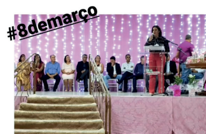
Morrinhos assina adesão às ações do Pacto Goiano pelo Fim da Violência Contra a Mulher.