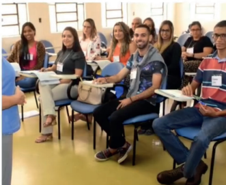
Superintendência de Desenvolvimento, Assistência Social e Inclusão promove curso para entrevistadores do Cadastro Único.