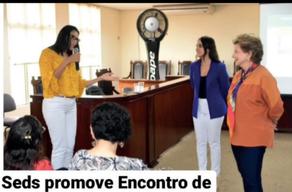
Seds promove Encontro de Gestores Municipais.