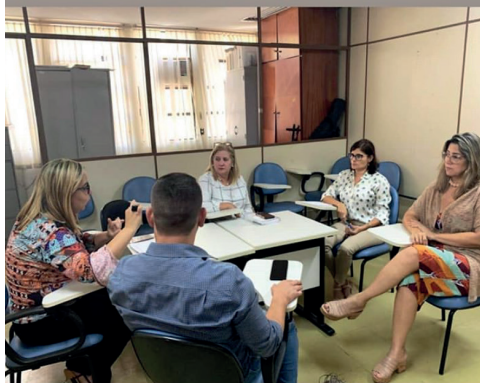
Apoio técnico presencial do Programa Criança Feliz para o município de Aparecida de Goiânia.