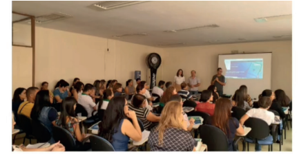
Treinamento da Carteira de Trabalho Digital e Seguro Desemprego.