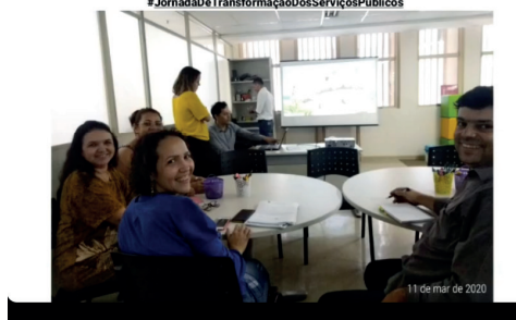
#Sedsgoias #SomosTodosGoiás #JornadaDeTransformaçãoDosServiçosPúblicos