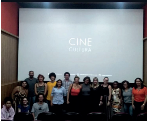
Ainda da tempo de conferir! Sessões hoje, amanhã e sexta-feira no CineCultura às 19h.