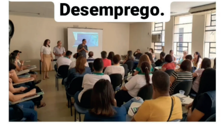
#Sedsgoias #SomosTodosGoiás #CarteiraDeTrabalhoDigital