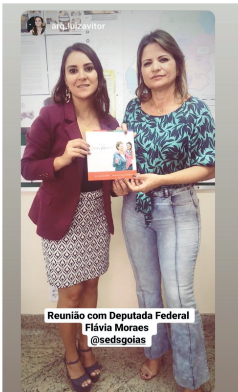
Reunião com Deputada Federal Flávia Moraes @sedsgoias