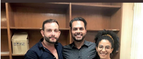
Apoio da Gerência da Diversidade Sexual do Estado ao mutirão para retificação do nome social para pessoas trans.