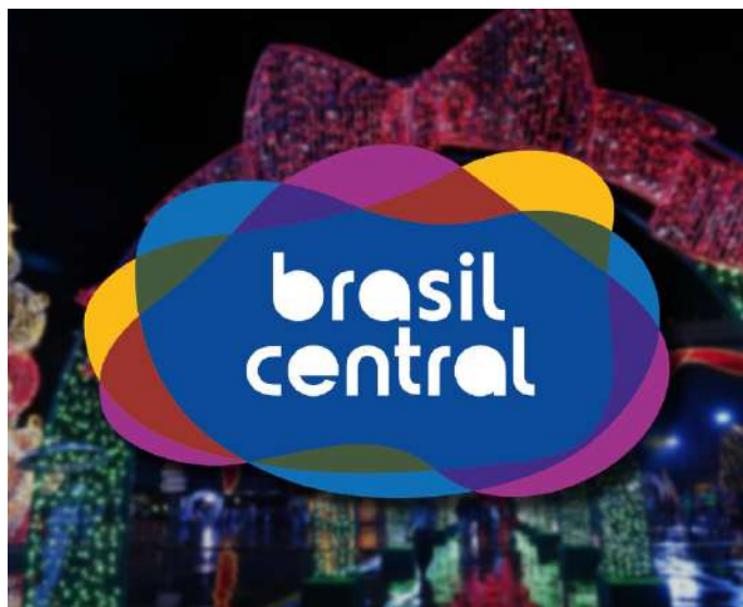
Brasil Central participa do maior Natal do Bem de todos os tempos