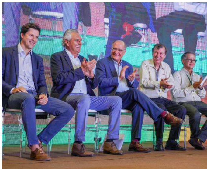
Caiado, Alckmin e Daniel Vilela entregam obras em Itumbiara